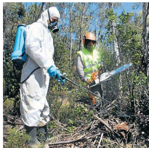
Una empresa especialitzada està eliminant els eucaliptus en 15 hectàrees de les Gavarres.

La presència d'eucaliptus al massís de les Gavarres té l'origen en les plantacions intensives promogudes el 1970 per la fàbrica de paper Torras Hostench, SA. En aquell moment semblava una bona oportunitat per rendibilitzar els terrenys no urbanitzables ocupats per boscos i camps de conreu abandonats. Per fer-ho, Torras Hostench va promoure una plantació d'eucaliptus a les comarques gironines amb un ambiciós projecte que pretenia posar a prova uns 100 varietats d'eucaliptus. Un cop feta la selecció dels clons d'arreu del món que millor s'adaptaven a les condicions ambientals locals i que eren més productius, es van