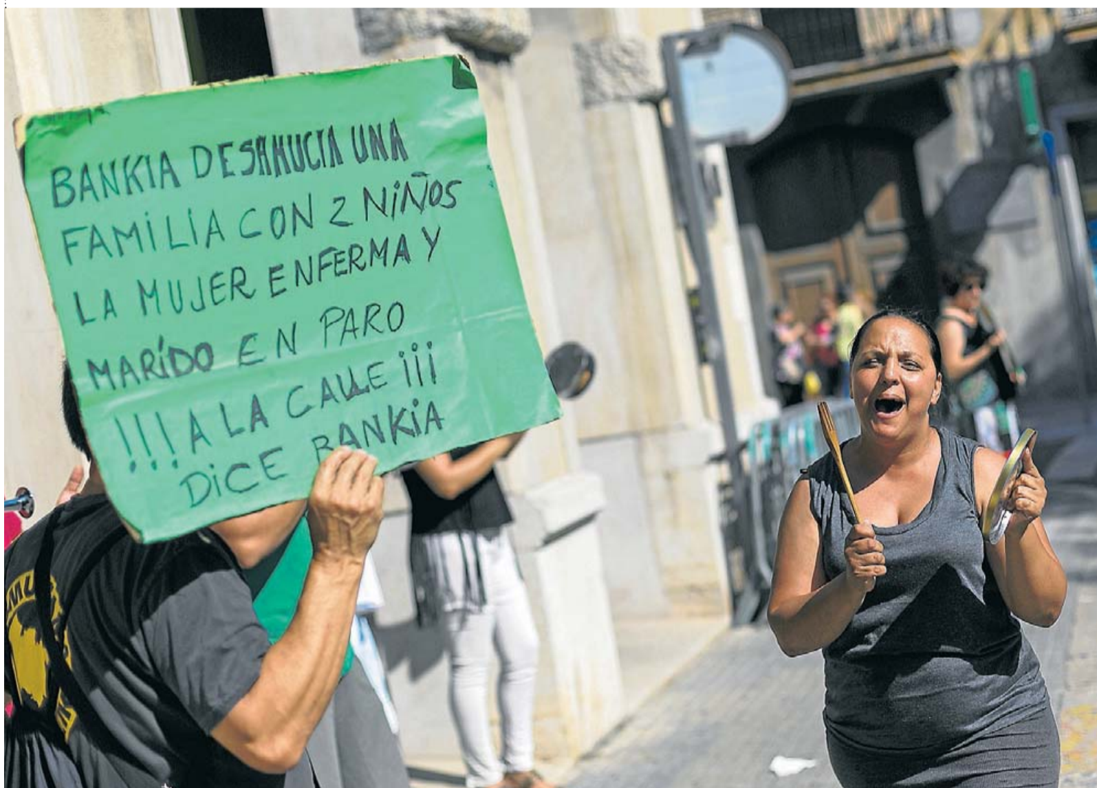
PAH: L'ACTIVISME CONSTANT AL CARRER

Hi ha màfies que cobren 500 € per obrir un pis buit i generen problemes de convivència