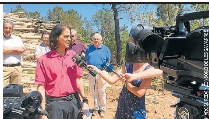
MARCSUREDA / TONSORCI DE LES CAVARRES

Les 400 hectàrees que ocupen arbres d'antigues papereres suposen un risc d'incendi